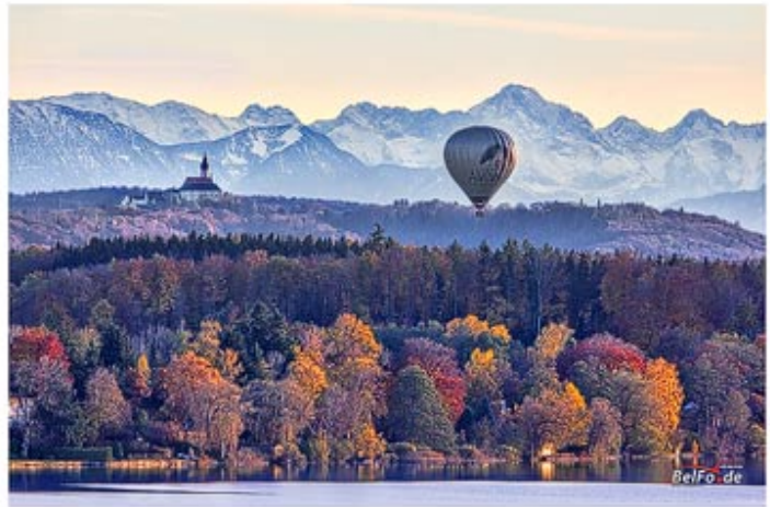
Föhnblick über den Wörthsee

Der seit Generationen als Familienbetrieb geführte Jakl-Hof mit seinen modernen und komfortabel ausgestatteten Zimmern bietet Urlaubsgästen und Geschäftsreisenden gleichermaßen ausgezeichnete Voraussetzungen für eine „gute Zeit“ im Hotel garni Jakl-Hof am Wörthsee.